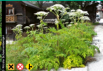
Riesen-Bärenklau ( Heracleum mantegazzianum )