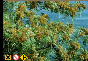
Götterbaum ( Ailanthus altissima )