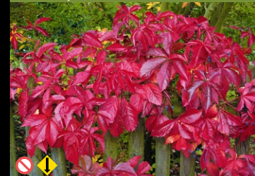
Gewöhnliche Jungfernebe ( Parthenocissus inserta )