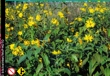
Topinambur, Knollige Sonnenblume ( Helianthus tuberosus )