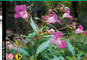
Drüsiges Springkraut ( Impatiens glandulifera )