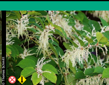
Japanischer Knöterich, Sachalin-Knöterich und Hybride ( Reynoutria japonica , R. sachalinensis )