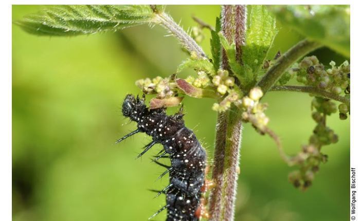
Einheimische Wildpflanzen dienen im Gegensatz zu Neophyten zahlreichen Arten als Nahrungsquelle.

lorbeers ( Prunus laurocerasus ). Bei Neophyten ohne heimische Verwandten wie etwa dem Essigbaum sieht die Bilanz noch schlechter aus.