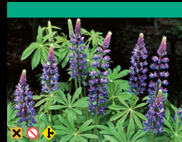
Vielblättrige Lupine ( Lupinus polyphyllus )