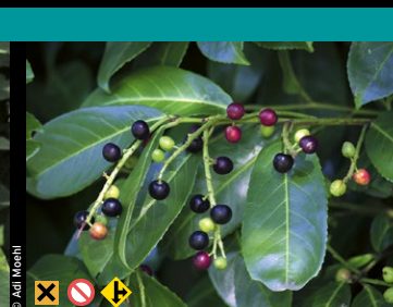
Kirschlorbeer ( Prunus laurocerasus ) [immergrün]