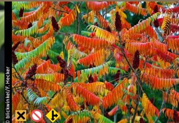
Essigbaum, Sumach ( Rhus typhina )