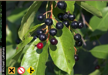
Spätblühende Traubenkirsche, Herbst-Traubenkirsche ( Prunus serotina )