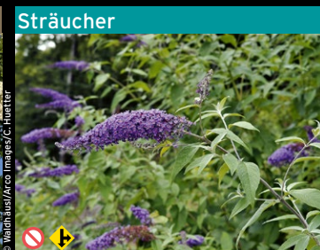
Schmetterlingsstrauch, Sommerflieder ( Buddleja davidii )