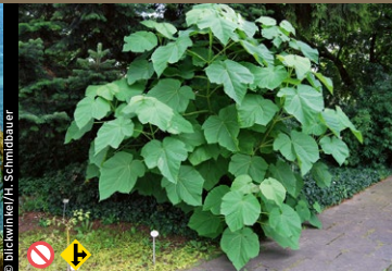
Blauglockenbaum, Paulownie ( Paulownia tomentosa )