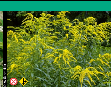
Kanadische Goldrute, Spätblühende Goldrute ( Solidago canadensis und S. gigantea )