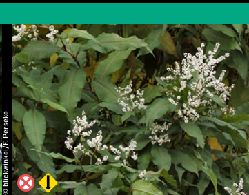
Himalaya-Knöterich, Vieljähriger Knöterich ( Polygonum polystachyum )